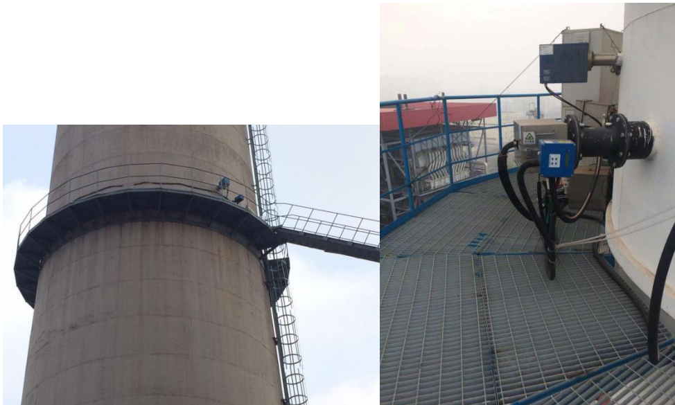
废气监测平台图片